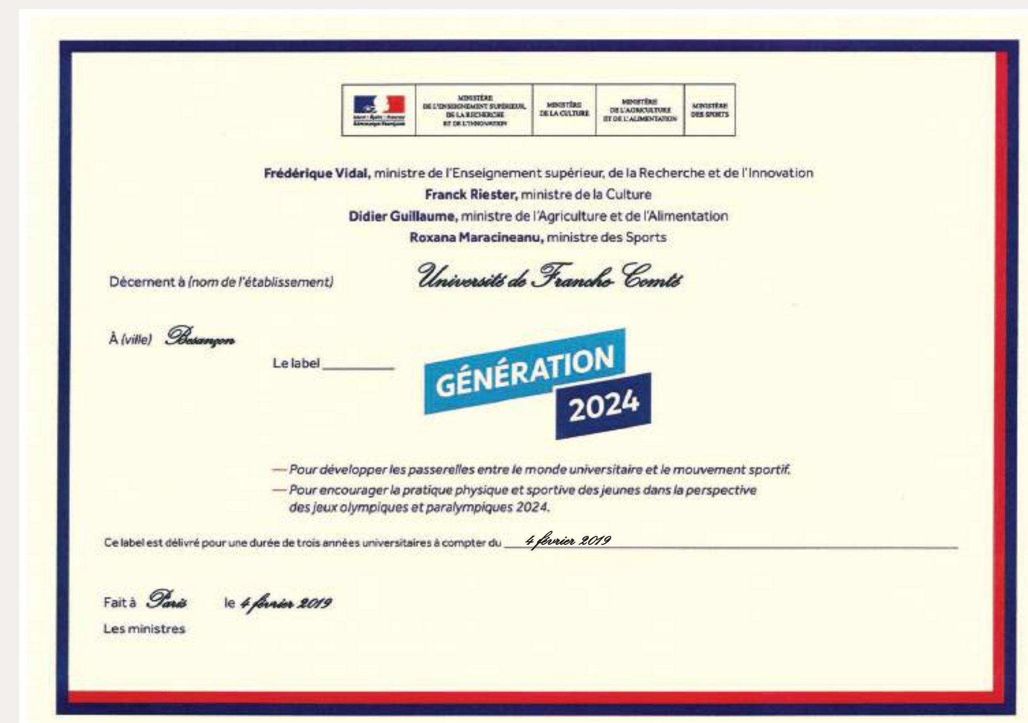
Diplôme «Génération 2024» décerné en 2019 à l'uFC

➤ Le CEROU est en lien direct avec la politique engagée en matière de recherche, de promotion du sport et des valeurs olympiques au sein de l'université de Franche-Comté (uFC) et de « Génération 2024 ».