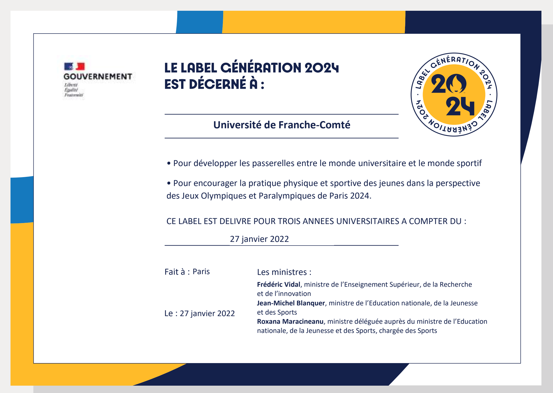
Diplôme «Génération 2024» décerné en 2022 à l'uFC

Comité d'organisation des Jeux olympiques et paralympiques Paris 2024, (2021), « Label génération 2024 », [en ligne], https://generation.paris2024.org/label-generation-2024